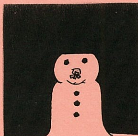
「ゆきのひのうさこちゃん」より