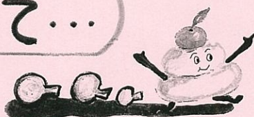
ついでにおせちりょうり もちの絵本より

クリスマスが あわると、つぎは おしょうがつですね。おもちをついて、おせちりょうりをつくって、としごしの じゅんびを します。ふゆやすみに よんでほしい えほんを あつめました。